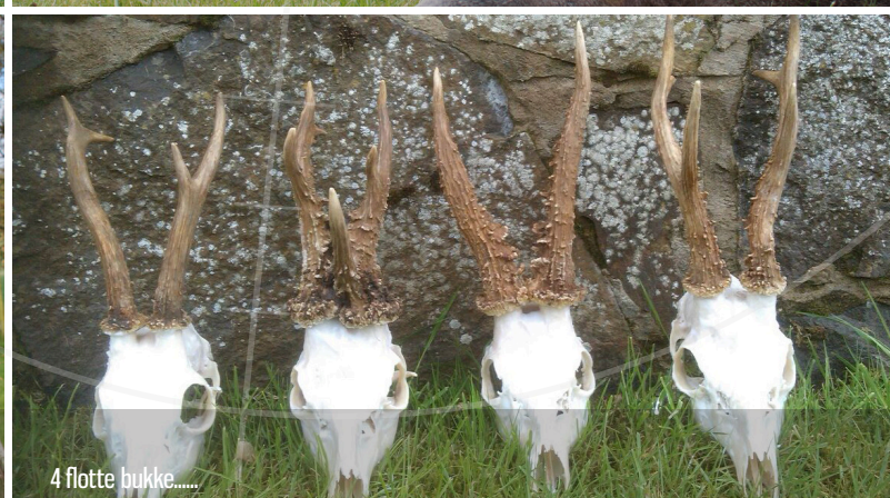
4 flotte bukke.....

GLOBUS JAGTREJSER | 6800 Varde www.globusjagtrejser.dk | info@globusjagtrejser.dk Tlf. 70 70 75 25 Medlem af rejsegarantifonden nr. 2602