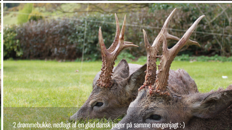
2 drømmebukke, nedlagt af en glad dansk jæger på samme morgenjagt :-)