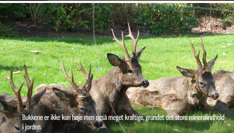
Bukkene er ikke kun høje men også meget kraftige, grundet det store mineralindhold i jorden.