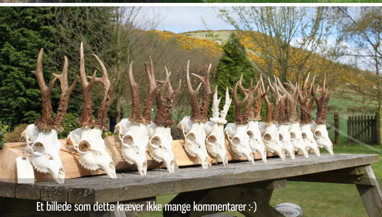
Et billede som dette kræver ikke mange kommentarer :-)