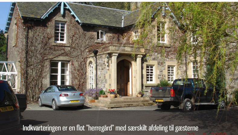
Indkvarteringen er en flot "herregård" med særskilt afdeling til gæsterne